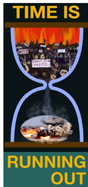
(Az idő egyre fogy...)

És... Mi mit teszünk ezzel kapcsolatban?